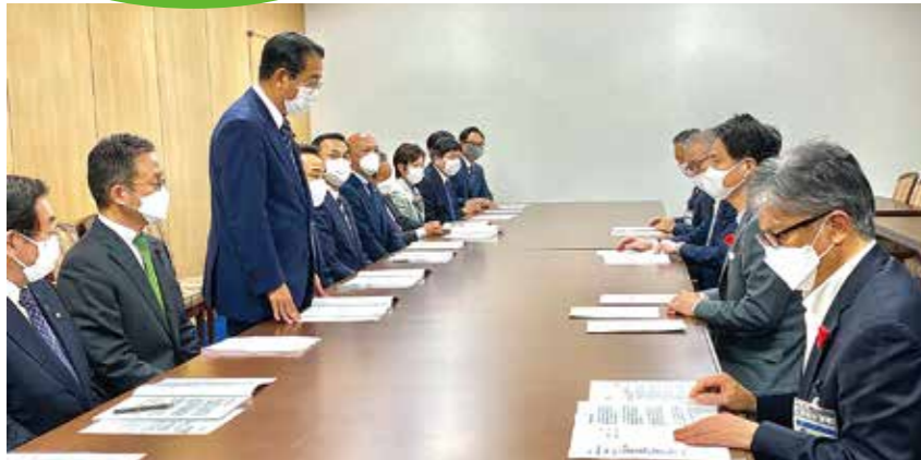
定期接種化について要望 (R4年10月14日)

高齢者の健康を脅かし、生活の質を低下させる带状疱疹の予防には、ワクチンが有効ですが、これまで全国の議会では、公明党が議論をリードし、各地で独自の一部助成が導入され負担軽減が図られています。公明党横浜市議員団もこうした動きと連携して「接種費用の助成」と「国への定期接種化の働きかけ」を横浜市に求めてきました(下記年表参照)。