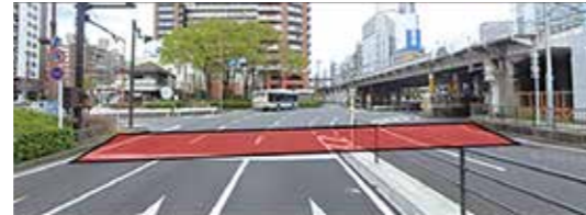
横断歩道の整備イメージ

地下鉄高島町駅2番出口付近の国道16号への横断歩道設置を令和3年より推進し、今年8月の県警協議にて横断歩道設置の了承が得られました。局長は、「今後は、横浜国道事務所にて設計を行い、県警との交通協議を実施し、交差点改良工事に着手予定であり、市として早期に工事着手ができるよう関係機関に働きかけを行う」と答弁しました。